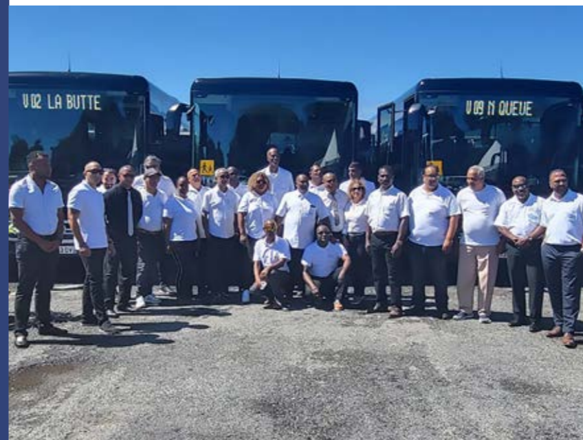
L'équipe de l'Est se réjouissant des nouveaux véhicules

Le territoire de l'Est s'est distingué au cours de ce second semestre par la réception de nouveaux cars. Le site de Sainte-Suzanne a en effet fêté, le 16 août dernier, l'arrivée de 10 Intouro flambant neufs, de couleur "noir" (boîte automatique, double vitrage fumé...) ; une manière de marquer visuellement l'introduction de cette nouvelle génération de véhicules sur le territoire de la CIREST.