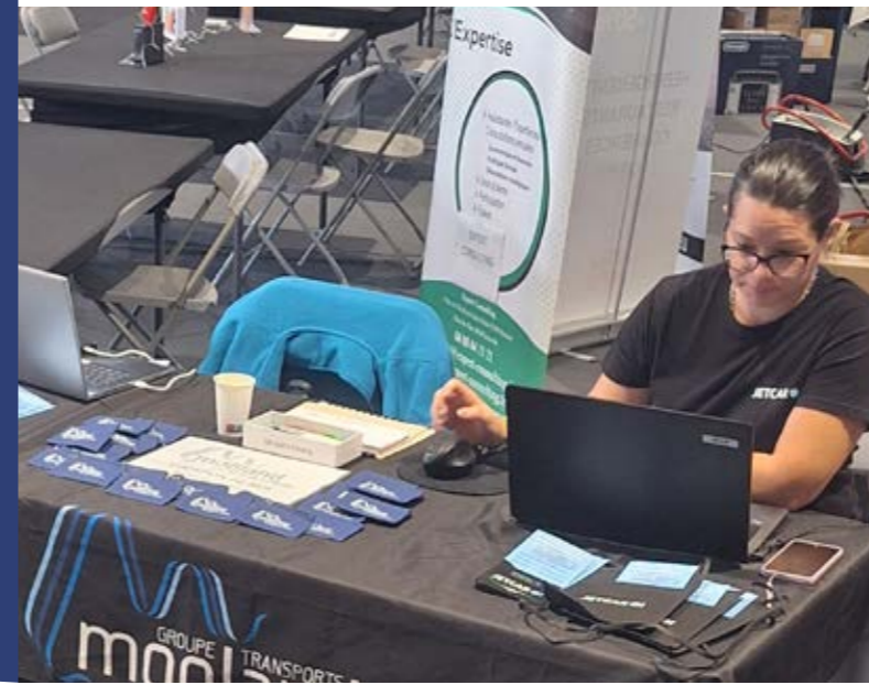
Salon des seniors, octobre 2023

Le Salon du CSE : Il a eu lieu cette année à la NORDEV, les 6 et 7 septembre. Il a permis au Groupe de conforter son partenariat avec les autres CSE de l'île ; une centaine de contacts a été ainsi établie avec les clients potentiels.