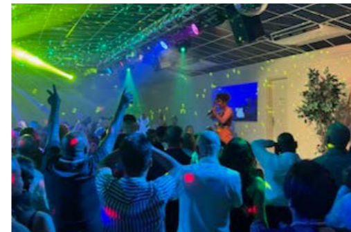
Soirée du personnel du 19 décembre 2023

C'était une demande forte du CSE à laquelle le Groupe n'a pas pu répondre jusqu'ici, à son grand regret. En cette fin d'année 2023, l'occasion lui a été donnée de concrétiser ce projet et le 19 décembre, c'est avec bonheur que les salariés amateurs de 2 roues ont pris possession de leur espace.